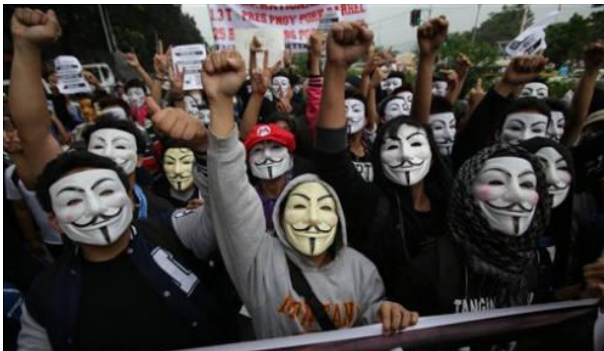
Figura 1. Marcha del Millón de Máscaras.

Al igual que en el pasado algunos movimientos sociales forzaron importantes cambios políticos en distintos países, Anonymous ha conseguido que la transparencia sea un valor requerido o exigido a los gobernantes de varios países. Por todo ello, es el reflejo de los cambios que experimentan los movimientos sociales a raíz de la capacidad de acción que ofrece un profundo conocimiento del uso y alcance de Internet.