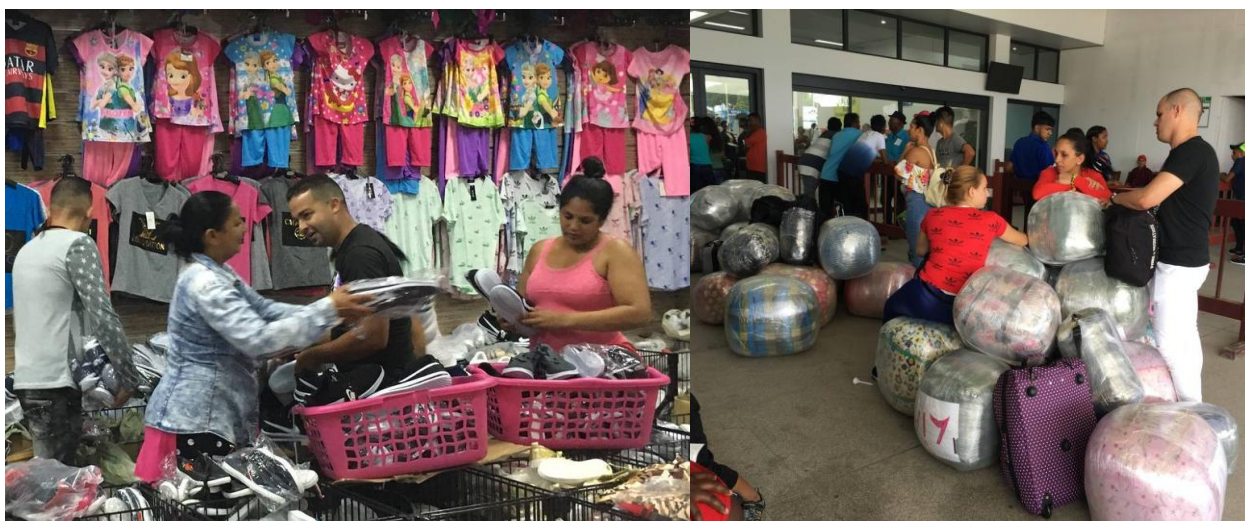
Fotos: cubanos realizando compras en un mercado de Guyana, luego el chequeo en el aeropuerto de Georgetown.

Los viajes de cubanos a destinos populares para compras como Cancún, se han multiplicado desde que, en el 2013, el gobierno cubano eliminó el permiso de salida, una traba que durante décadas impidió que los cubanos viajaran libremente. Ernesto Soberón, director de Asuntos Consulares de la cancillería cubana, informó que entre 2013 y 2016 más de 670 mil cubanos viajaron al exterior y el 78% lo hizo por primera vez. Agregó que de esa cifra “solo un 9 por ciento emigró, o sea, no regresó al país dentro del periodo de los 24 meses establecidos en la nueva Ley Migratoria vigente desde el 14 de enero de 2013”. 3